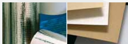
Ytskikt för byggnads- och isoleringsmaterial